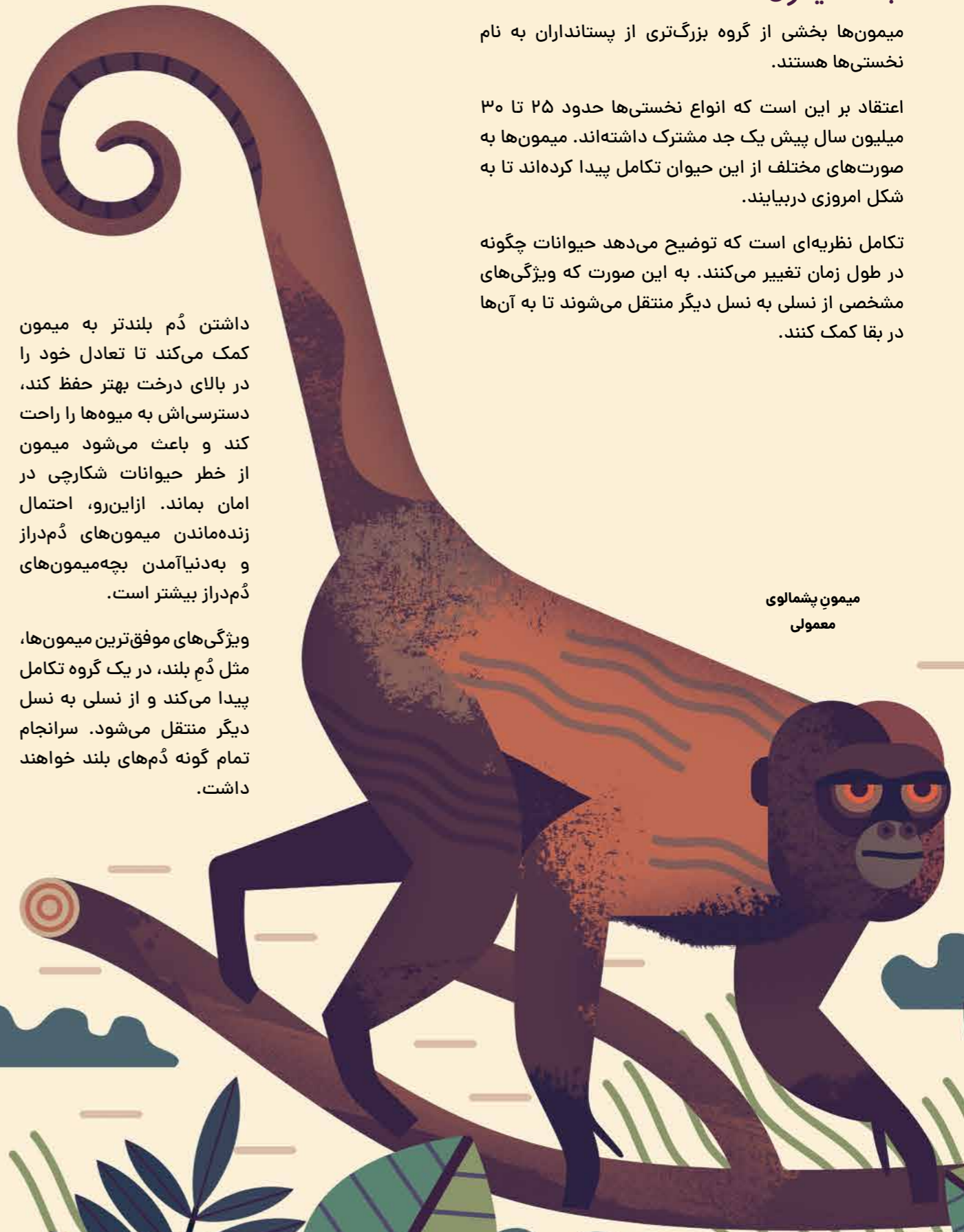
میمون پشمالوی معمولی

داشتن دم بلندتر به میمون کمک می‌کند تا تعادل خود را در بالای درخت بهتر حفظ کند، دسترسی‌اش به میوه‌ها را راحت کند و باعث می‌شود میمون از خطر حیوانات شکارچی در امان بماند. از این رو، احتمال زنده ماندن میمون‌های دم‌دراز و به دنیا آمدن بچه میمون‌های دم‌دراز بیشتر است.